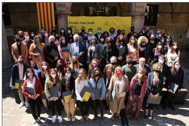
Els guanyadors dels Premis Sant Jordi 2021.